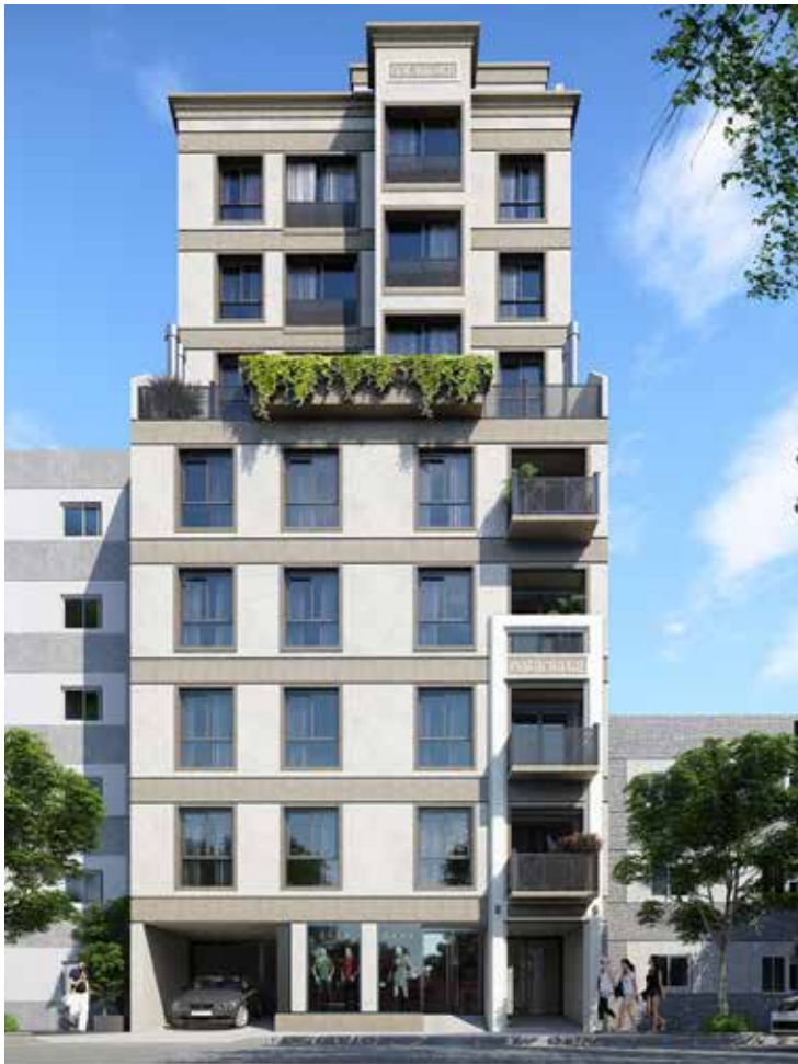
VICENTE LÓPEZ 1456