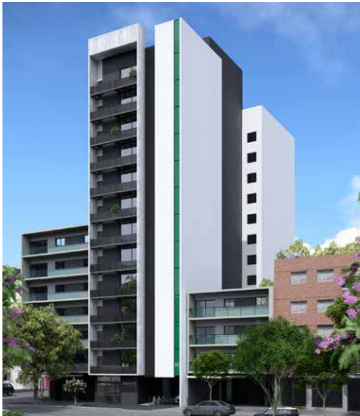
AV. ALEM 110