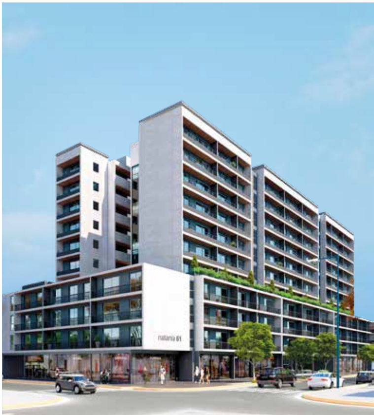
LEGUIZAMÓN 50 ESQ. PERITO MORENO