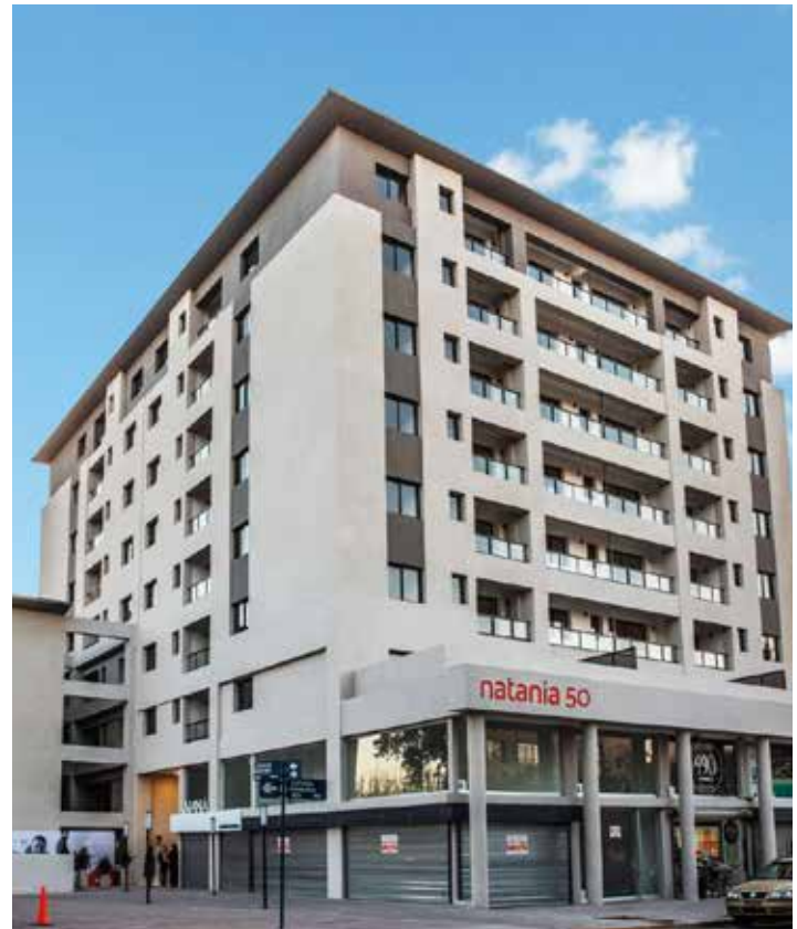
AV. BELTRÁN ESQ. CABILDO ABIERTO