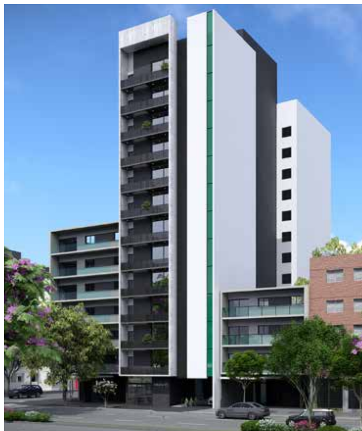
AV. ALEM 110