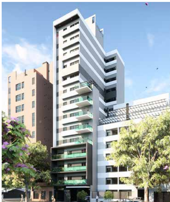
AV. AVELLANEDA 812