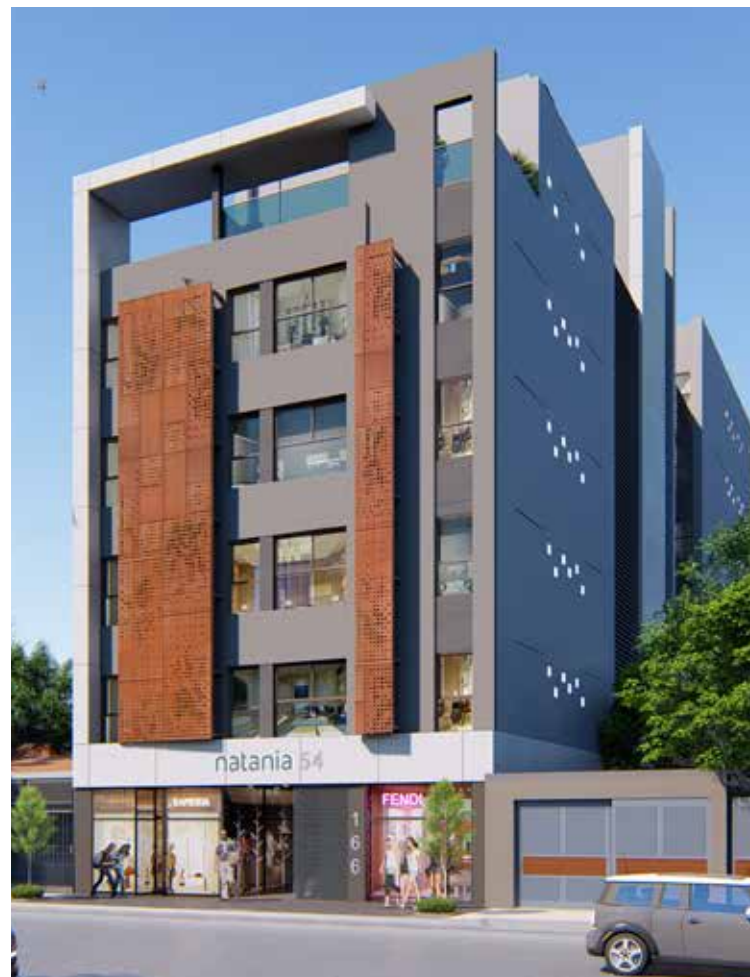
9 DE JULIO OESTE 166