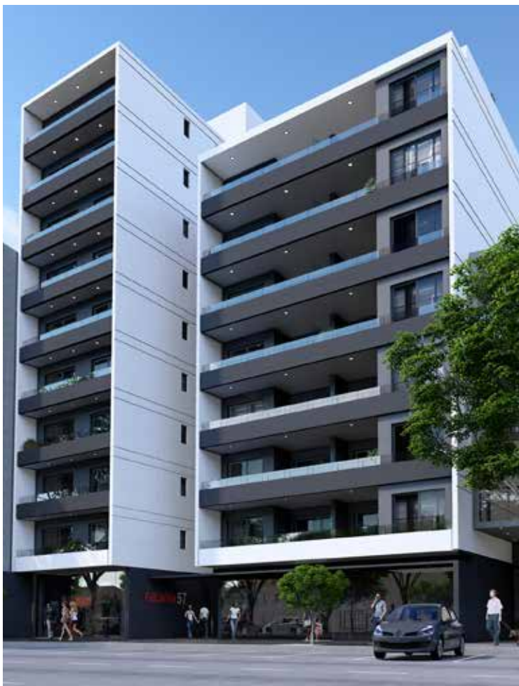
IGNACIO DE LA ROZA OESTE 417