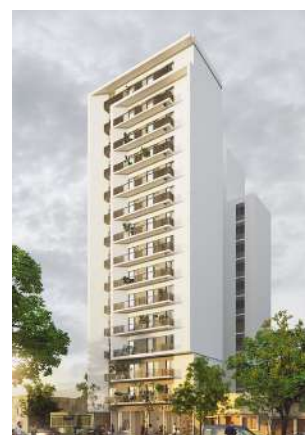
Natania 82 /// Av. Alem 121