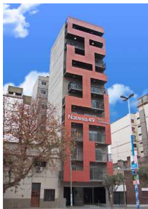
Natania 49 /// Av. Avellaneda 585