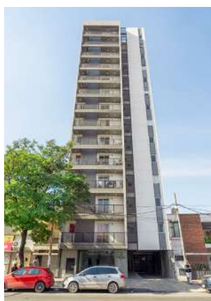
Natania 69 /// Av. Alem 110