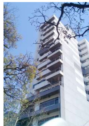
Natania 59 /// Av. Avellaneda 812